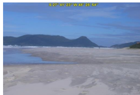
Praia do Campeche