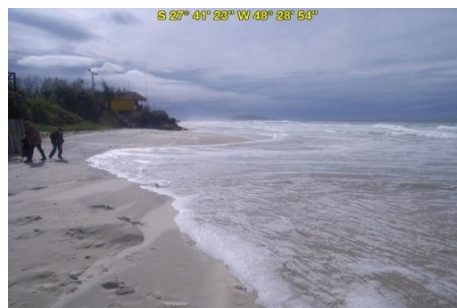
Praia do Campeche