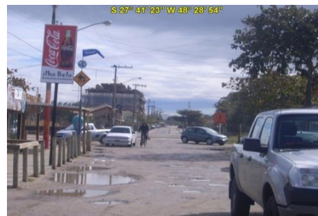
Acesso à Praia do Campeche