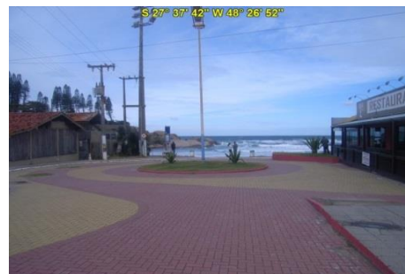
Acesso à Praia da Joaquina