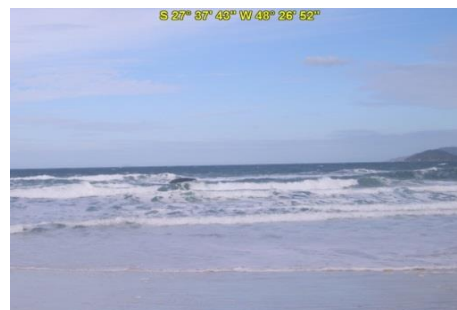
Praia da Joaquina