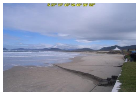
Praia da Joaquina