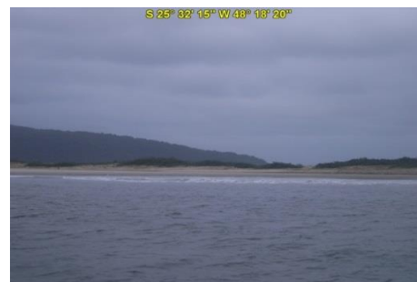
Praia do Farol