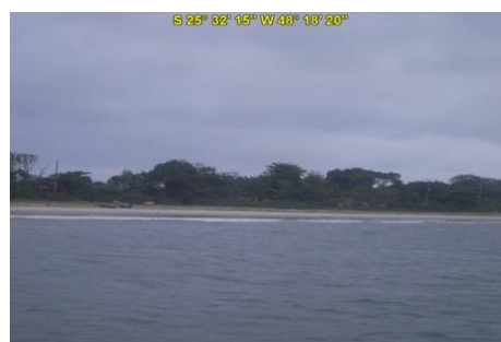
Praia do Farol