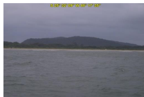
Praia do Farol