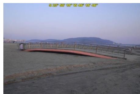
Canal na Praia Gonzaga