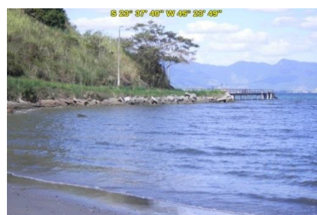
Praia do Camaroeiro