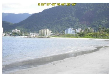
Praia do Camaroeiro