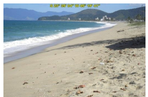
Praia da Cocanha