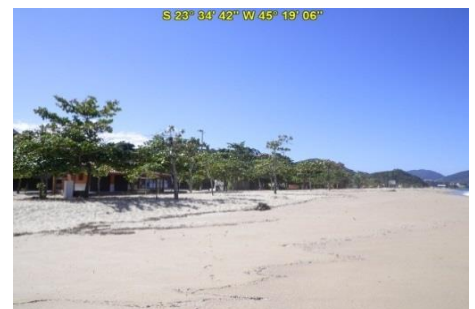
Praia da Cocanha