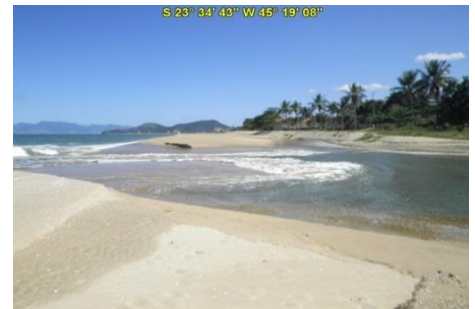
Foz do Rio Cocanha