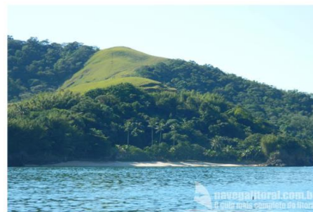
Praia do Timbó