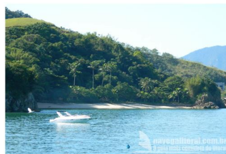
Praia do Timbó