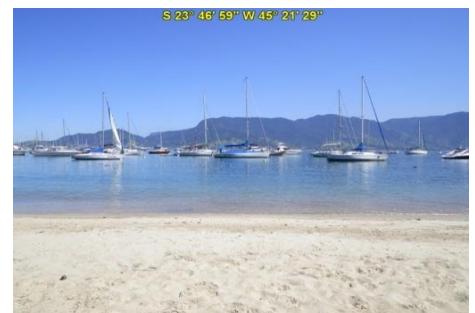
Praia do Saco da Capela