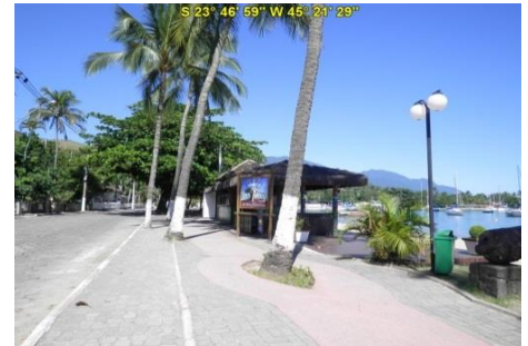
Acesso à Praia do Saco da Capela