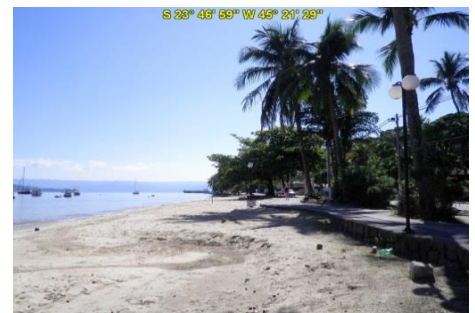
Praia do Saco da Capela