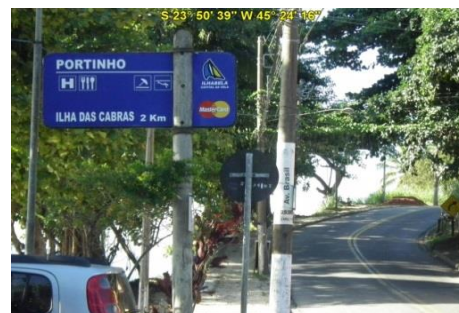
Acesso à Praia do Portinho