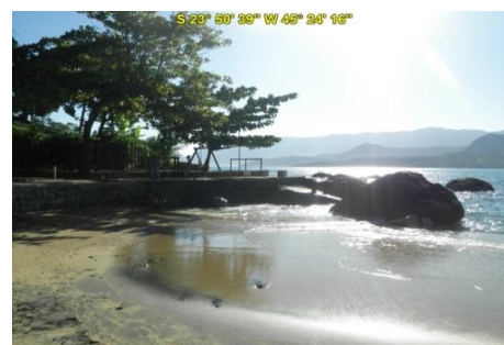
Praia do Portinho