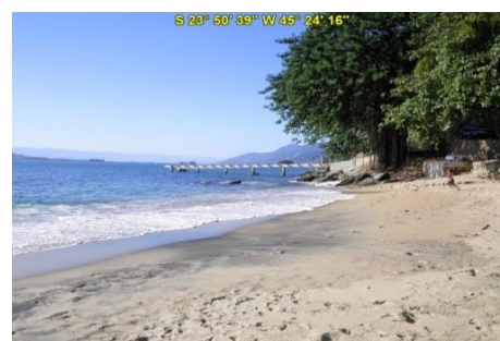
Praia do Portinho