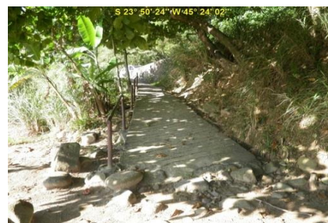
Acesso à Praia do Oscar