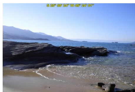
Praia do Oscar