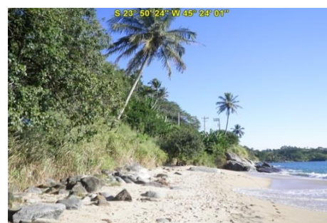
Praia do Oscar