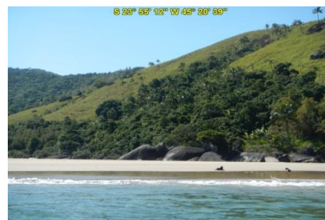
Praia do Bonete