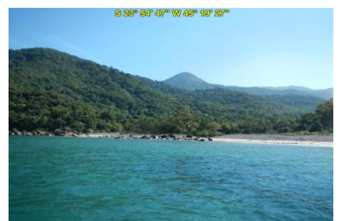
Praia de Anchovas