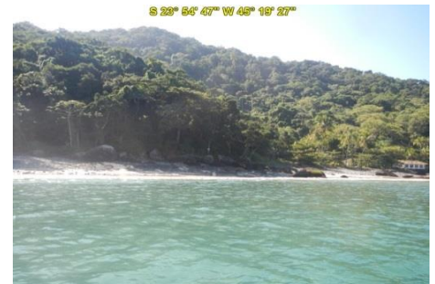
Praia de Anchovas