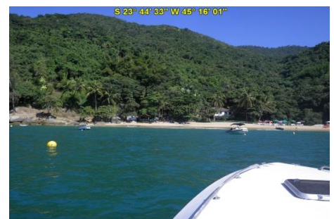
Praia da Fome