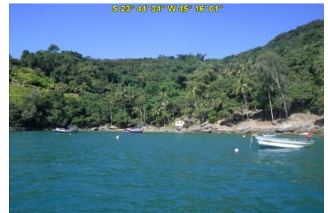
Praia da Fome