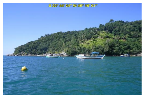
Praia da Fome