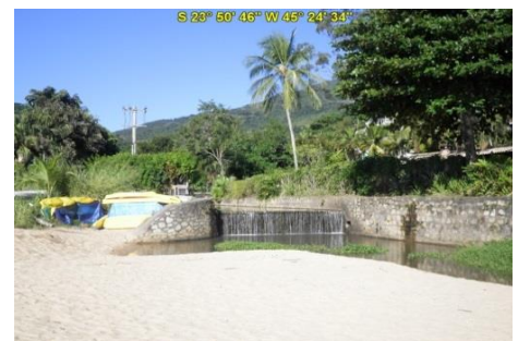
Praia da Feiticeira