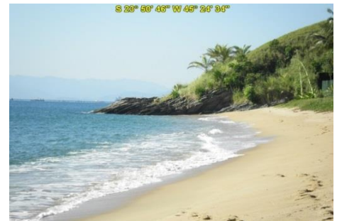
Praia da Feiticeira