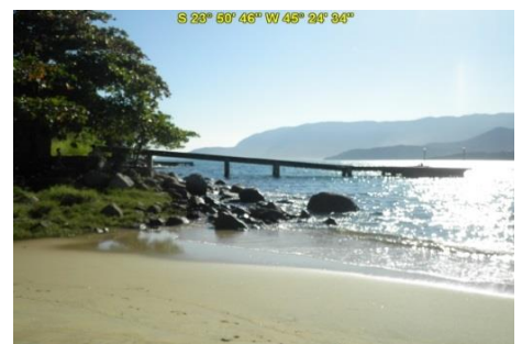
Praia da Feiticeira