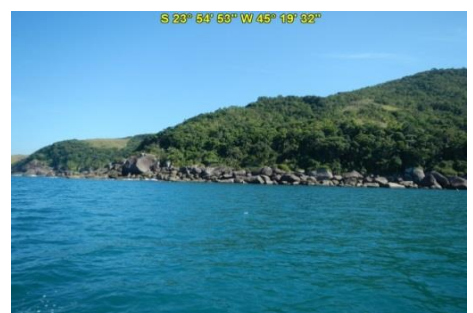
Praia da Caveira