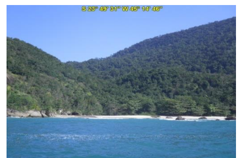
Praia da Caveira