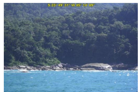
Praia da Caveira