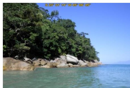
Depósito de tálus - Praia do Flamenguinho