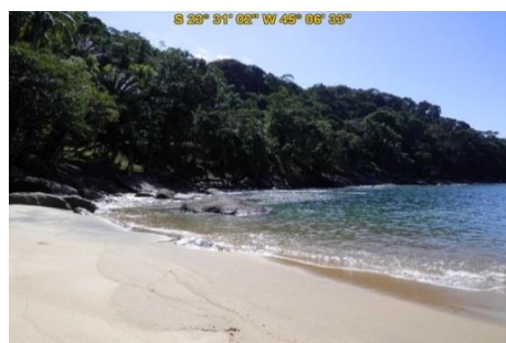
Praia do Flamenguinho