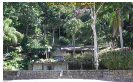
Praia do Flamenguinho