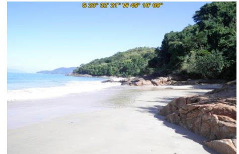
Praia do Cedro (sul)