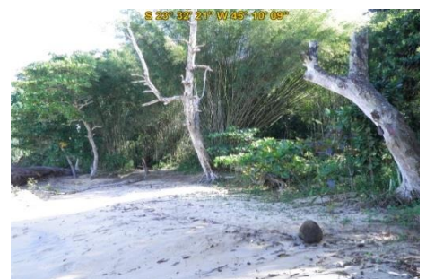
Praia do Cedro (sul)