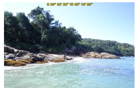
Praia do Cedro (sul)