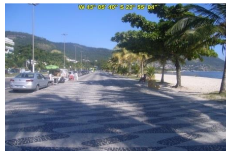
Acesso à Praia de São Francisco