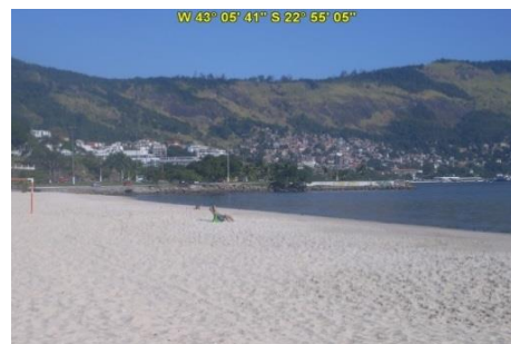
Praia de São Francisco