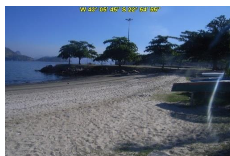
Praia de São Francisco