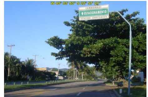
Acesso à Praia de Cambinhas