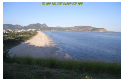
Praia de Cambinhas