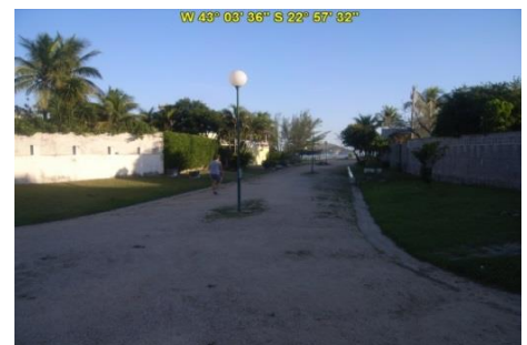
Acesso à Praia de Cambinhas