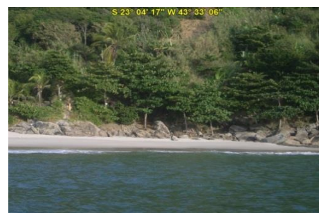
Praia do Perigoso