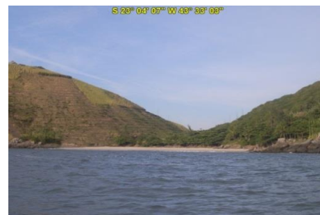
Praia do Perigoso