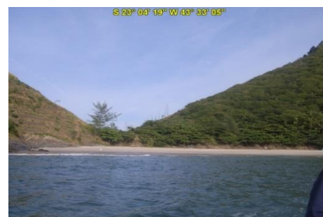
Praia do Perigoso