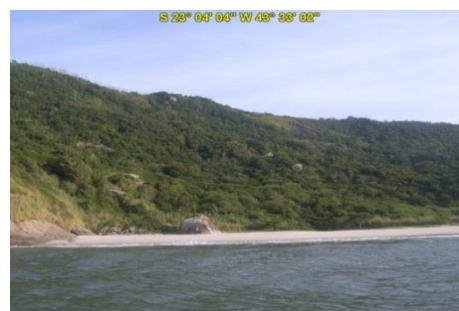
Praia do Meio