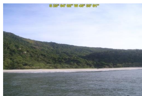
Praia do Meio