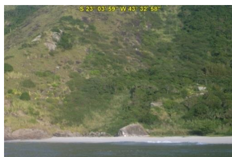
Praia do Meio