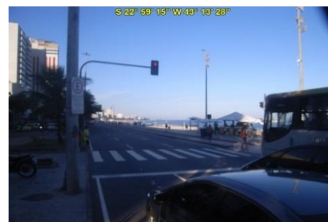
Acesso à Praia do Leblon