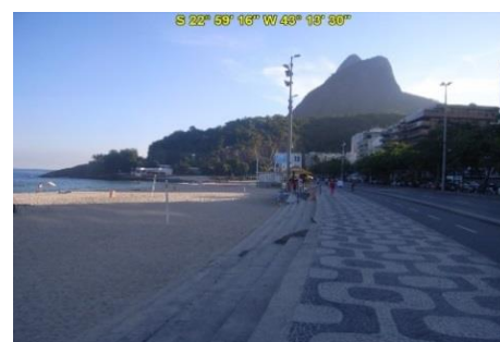
Praia do Leblon