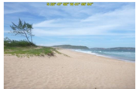
Praia do Tucuns