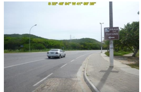
Acesso à Praia do Tucuns