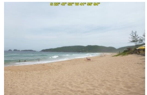
Praia do Tucuns