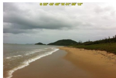
Praia da Gorda