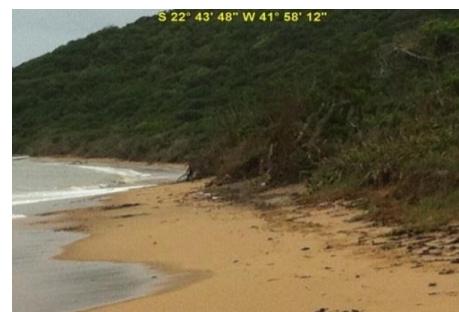
Praia da Gorda