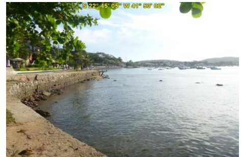
Praia da Armação