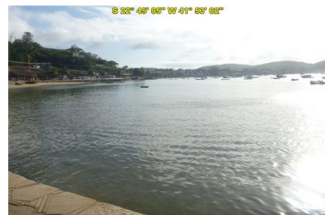
Praia da Armação