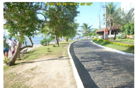
Praia da Armação