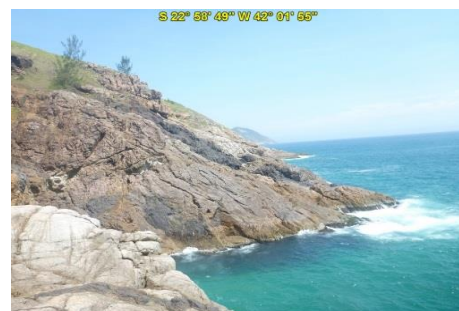
Praia Brava do Atalaia