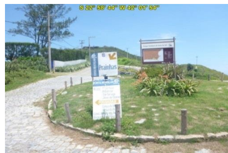
Acesso à Praia Brava do Atalaia