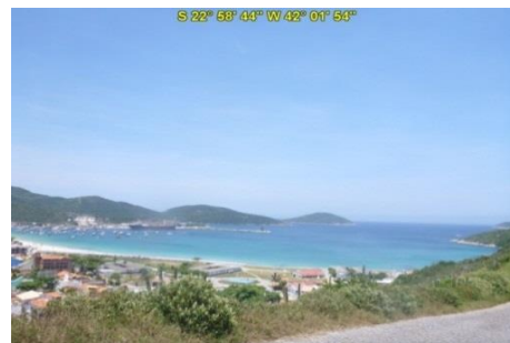
Acesso à Praia Brava do Atalaia