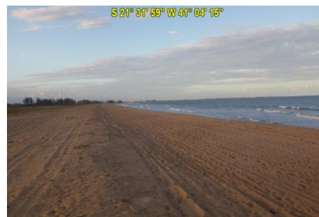
Praia Santa Clara