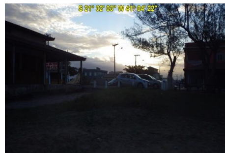
Acesso à Praia Santa Clara