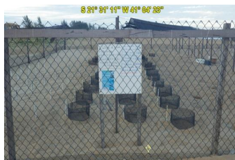
Área de Viveiro de Ninhos do TAMAR