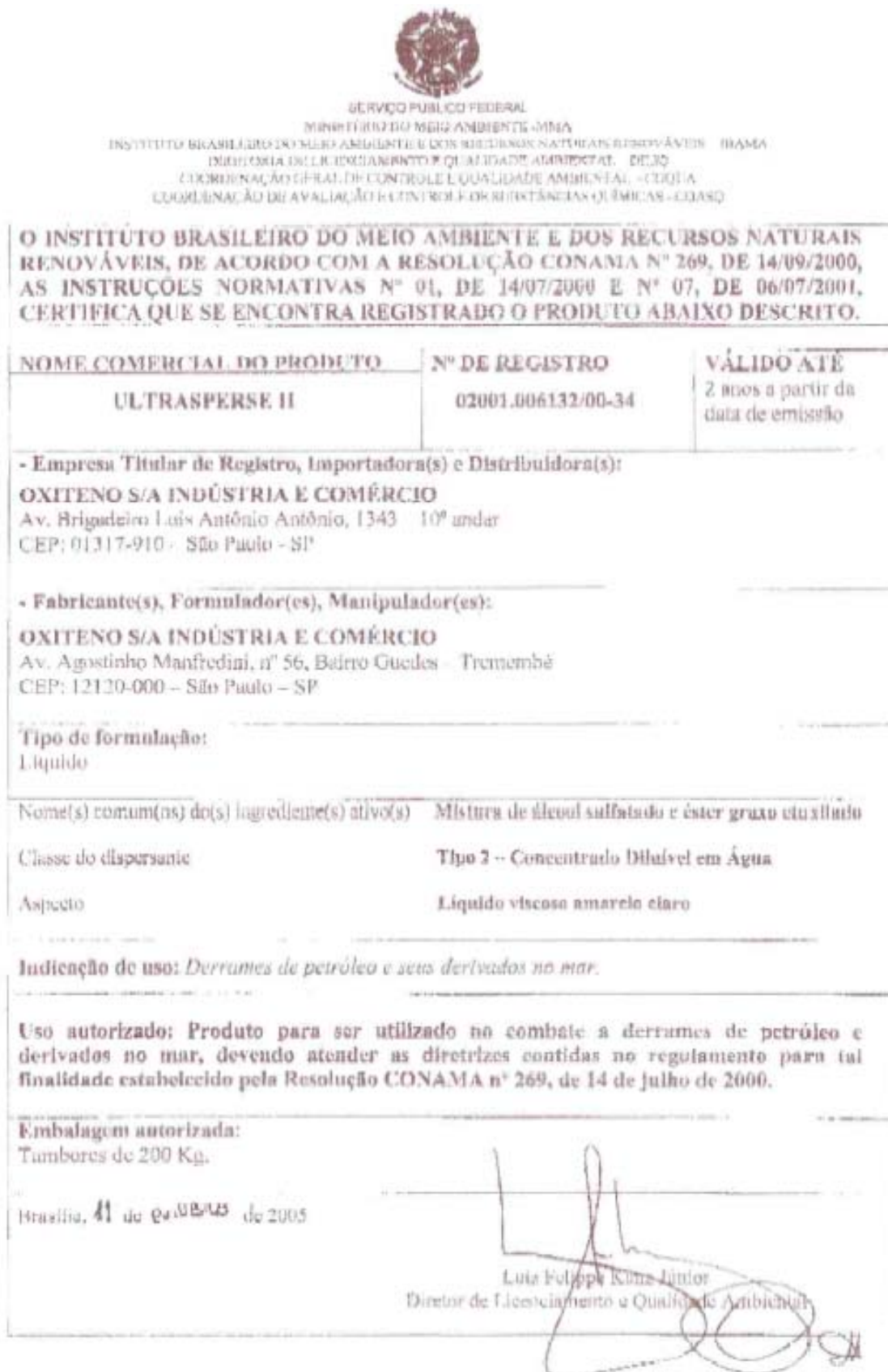
Figura I-2 - Certificado de renovação de registro do Ultrasperse II.