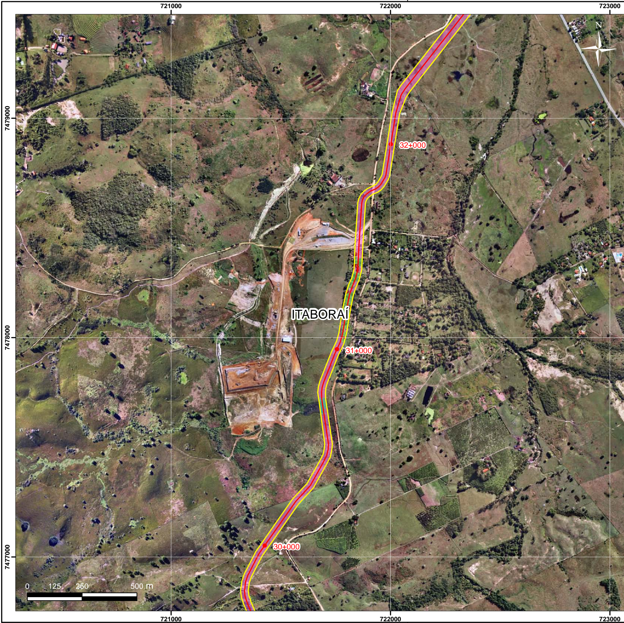
Mapa de Localização