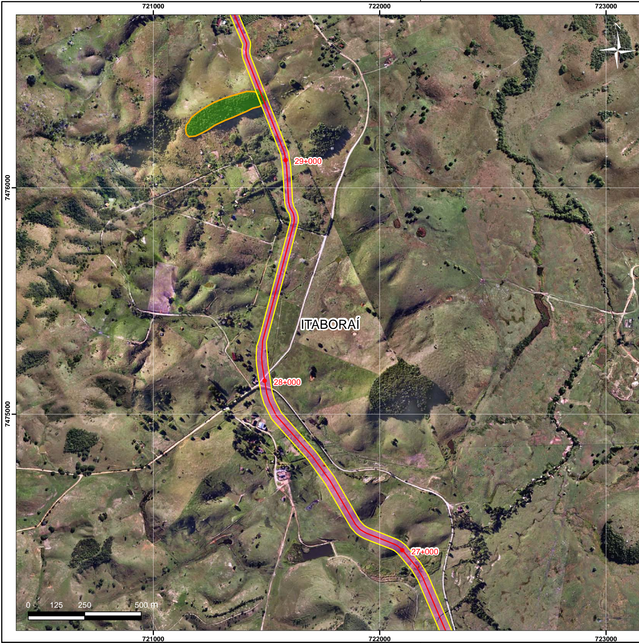
Mapa de Localização