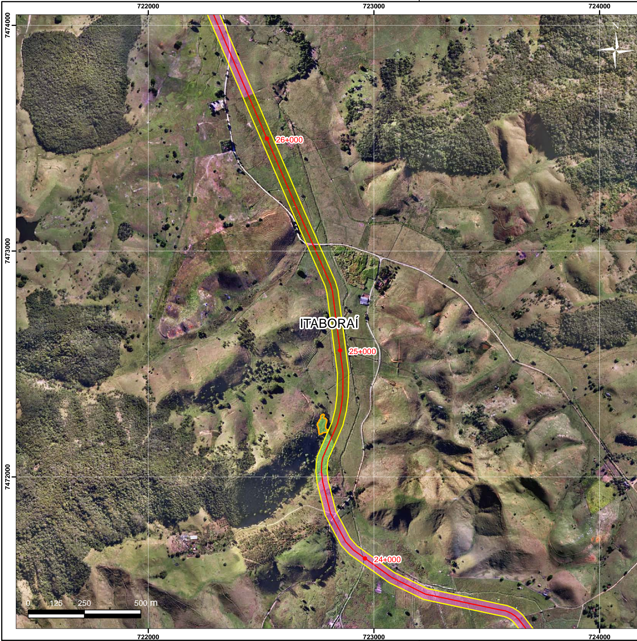
Mapa de Localização