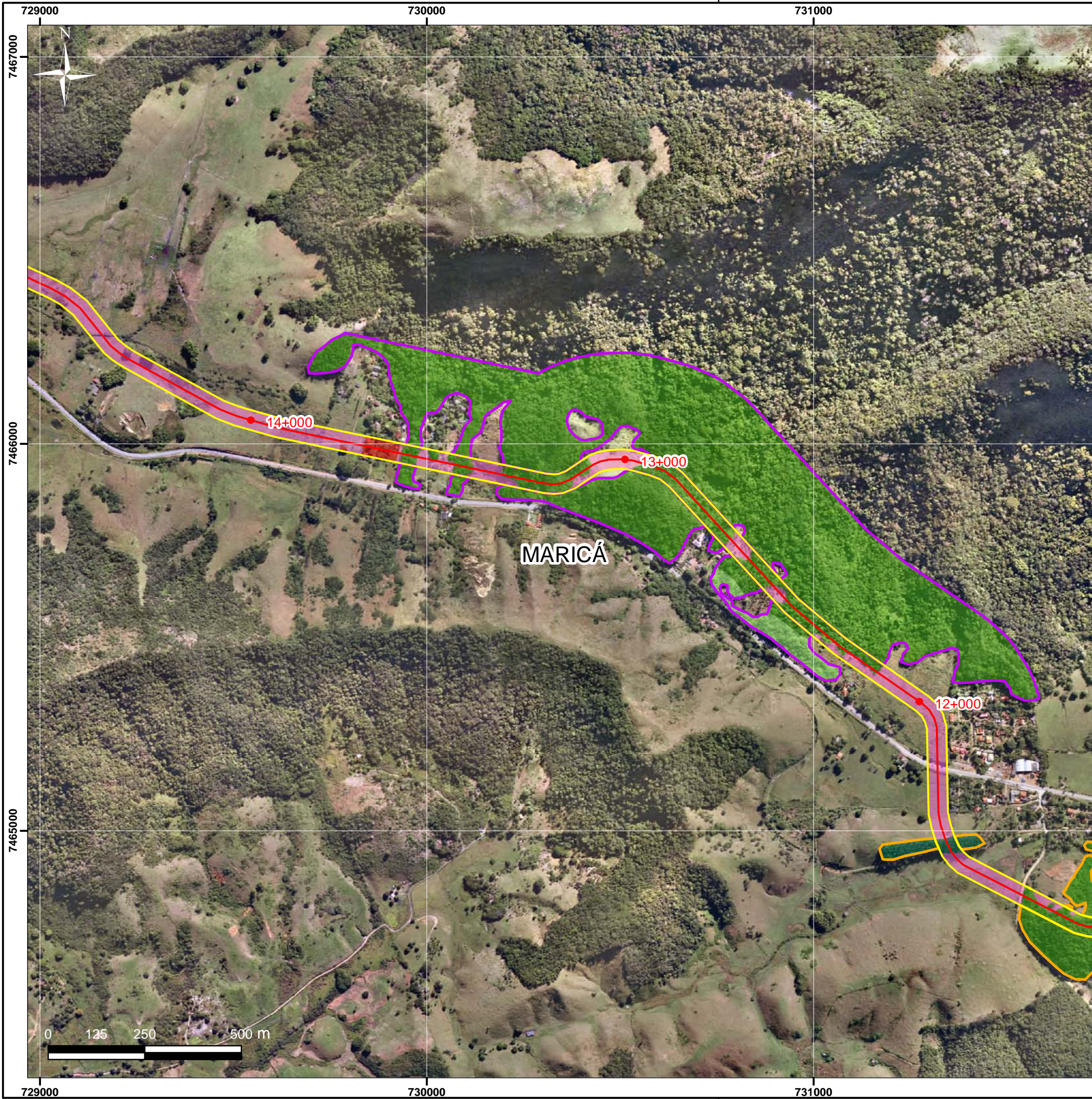
Mapa de Localização