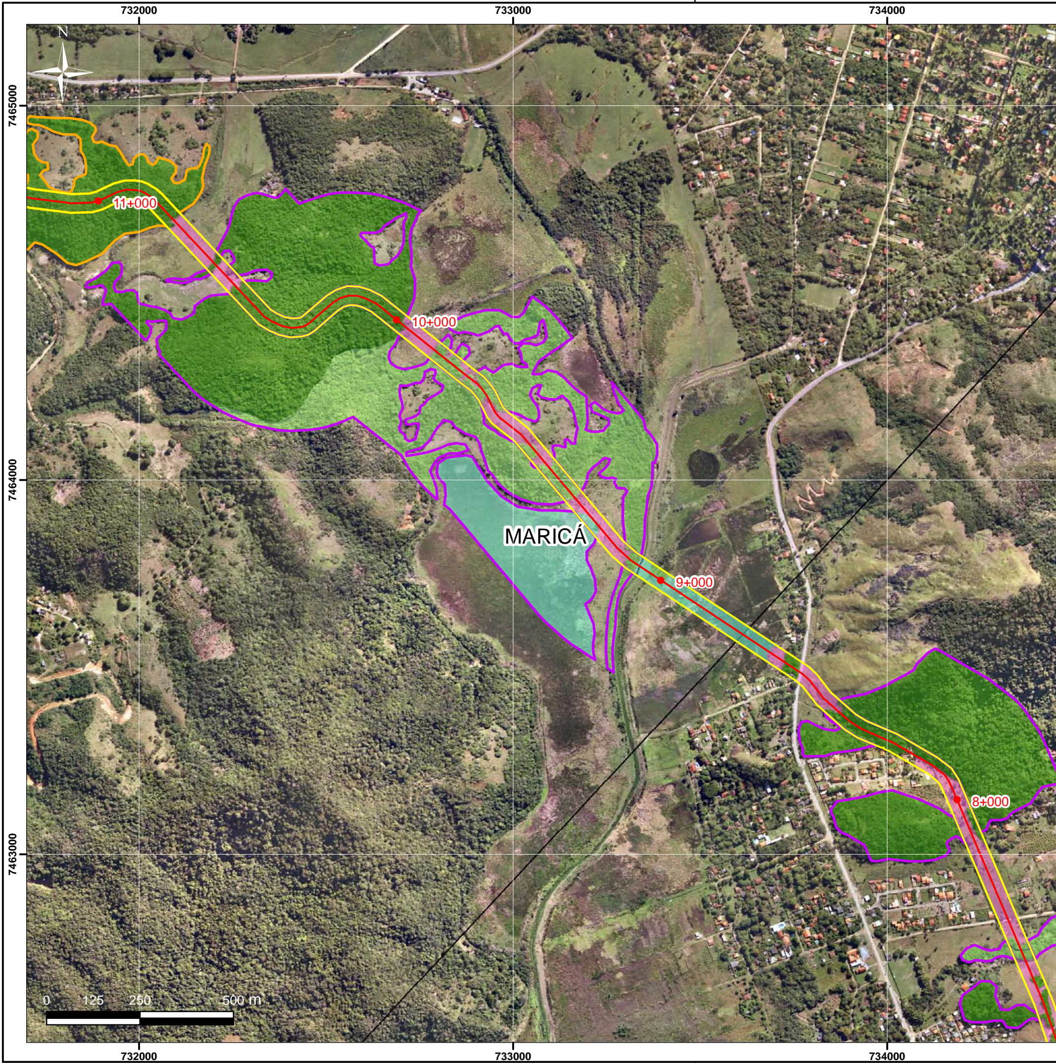
Mapa de Localização