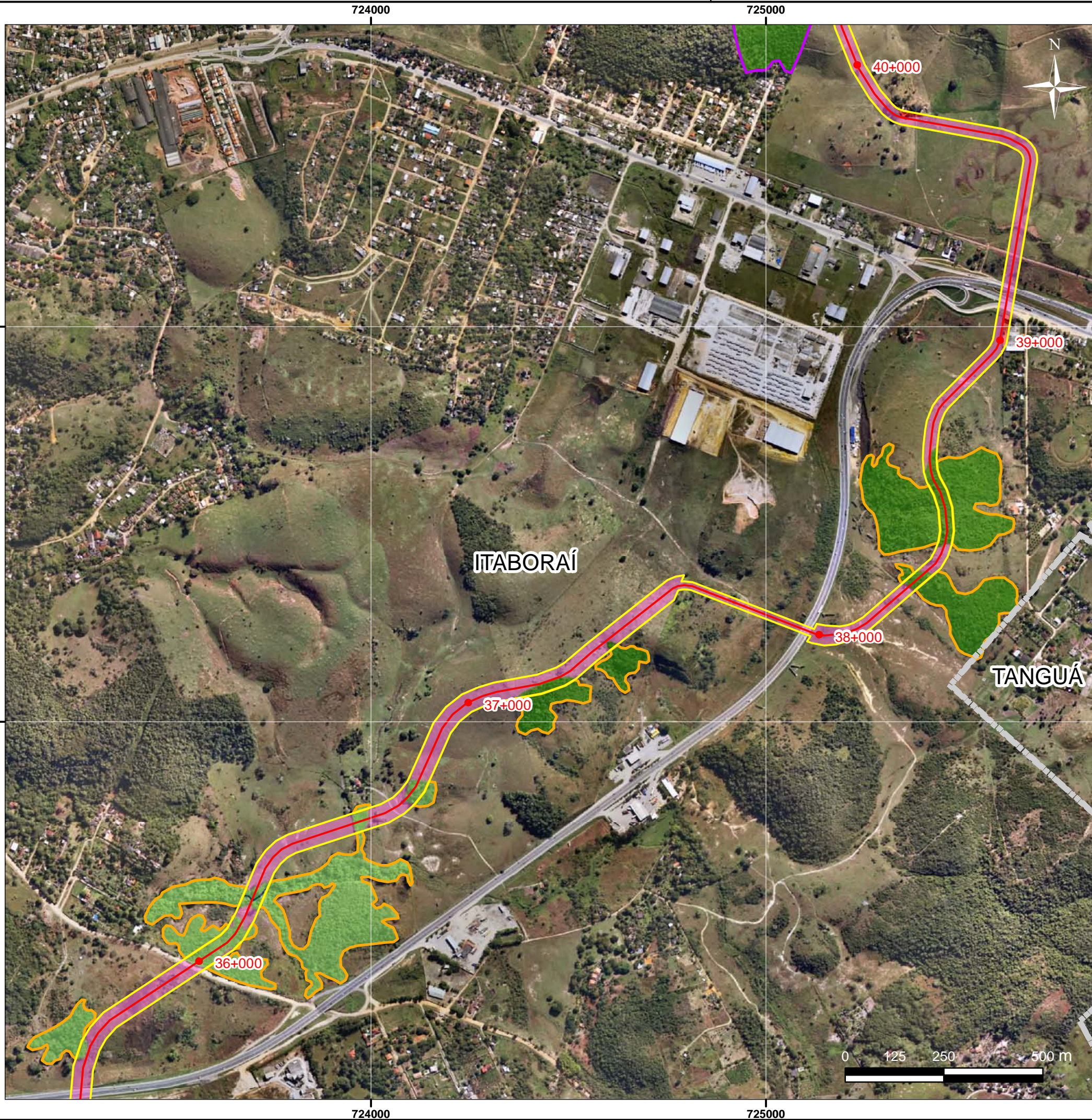
Mapa de Localização