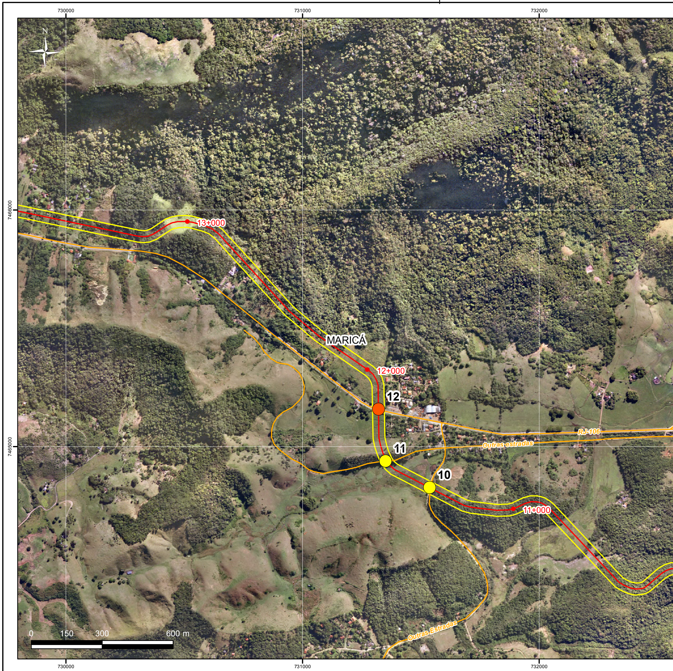
Mapa de Localização