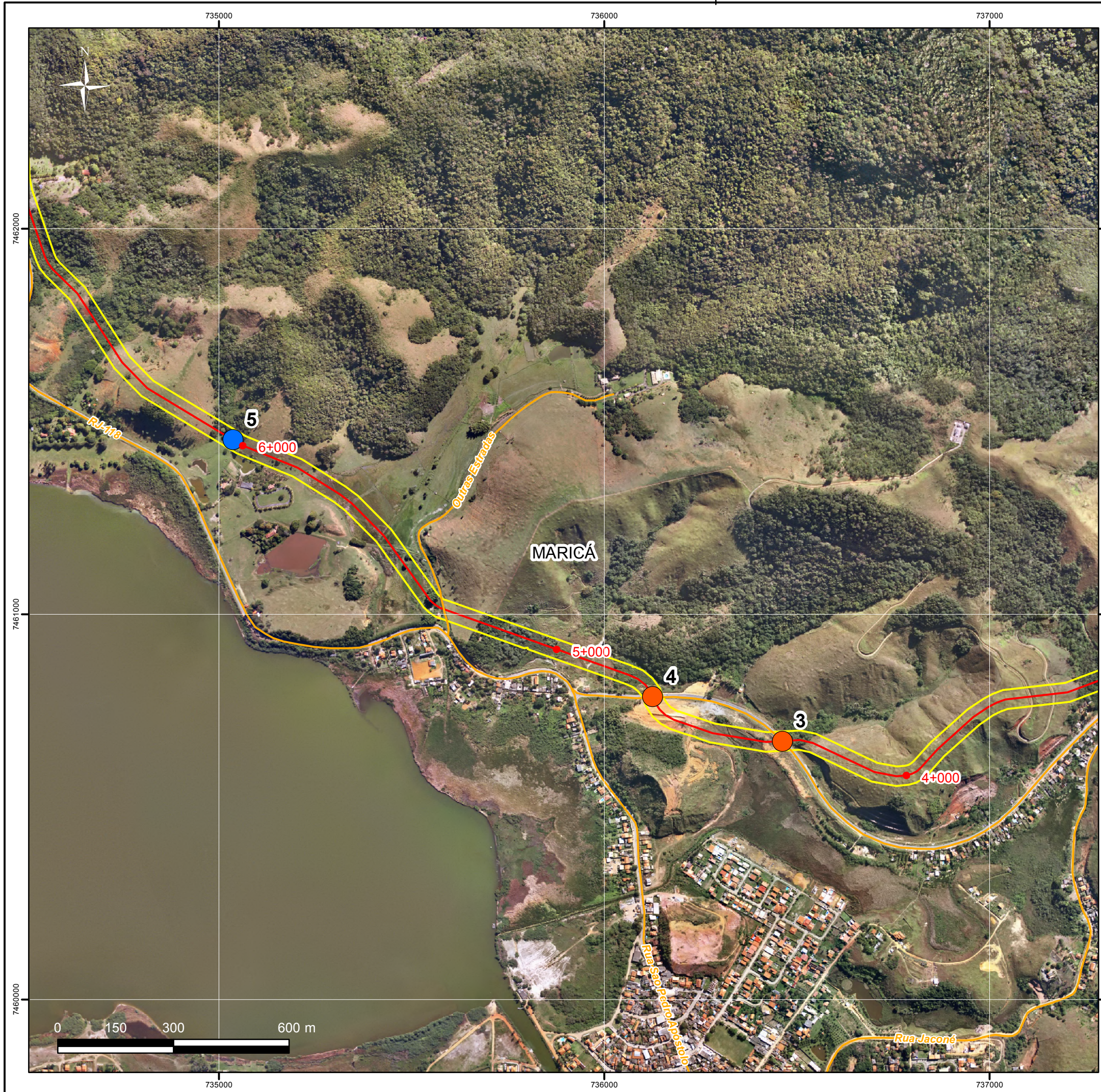
Mapa de Localização