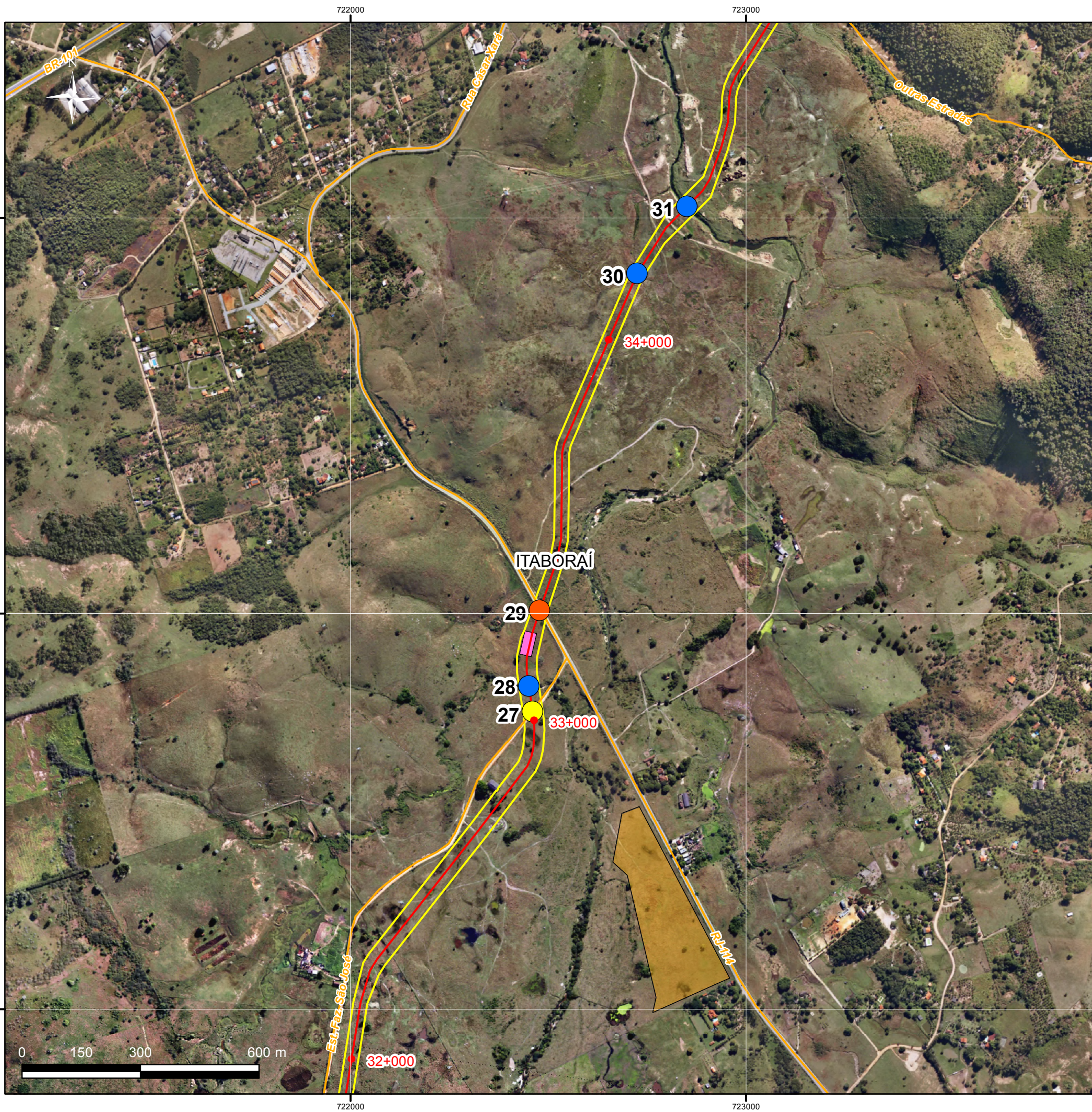
Mapa de Localização