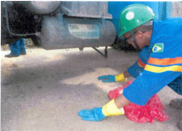
Foto 03 – Utilizado todo o conjunto do kit ambiental composto: recipiente contendo serragem, pá, mantas .