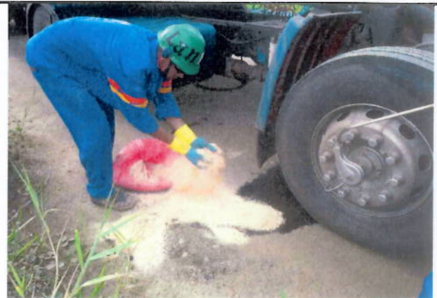
Foto 02 – Mitigação realizada. utilização pó de serra, do Kit ambiental..