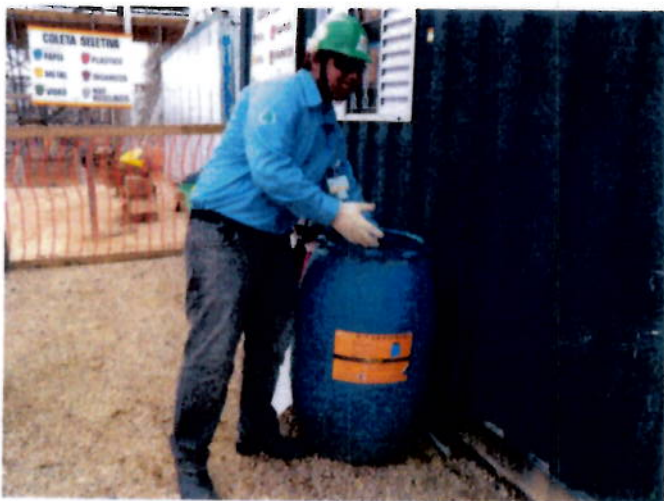
Foto 05 – Inspetor ambiental iniciando a contenção, pegando materiais necessários do kit ambiental .