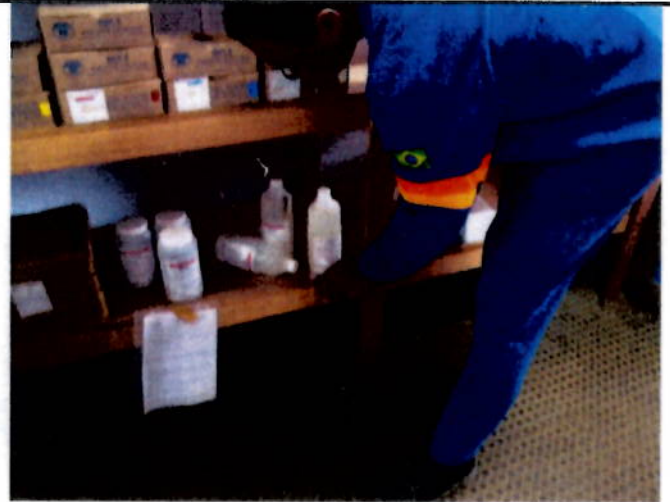
Foto 02 – Derramamento do suposto produto utilizado água para representar o produto líquida.