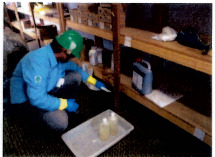
Foto 06 – Inspetor ambiental iniciando o a contenção, kit ambiental proximo da área estava completo completo.