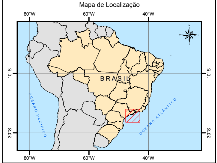
Mapa de Localização