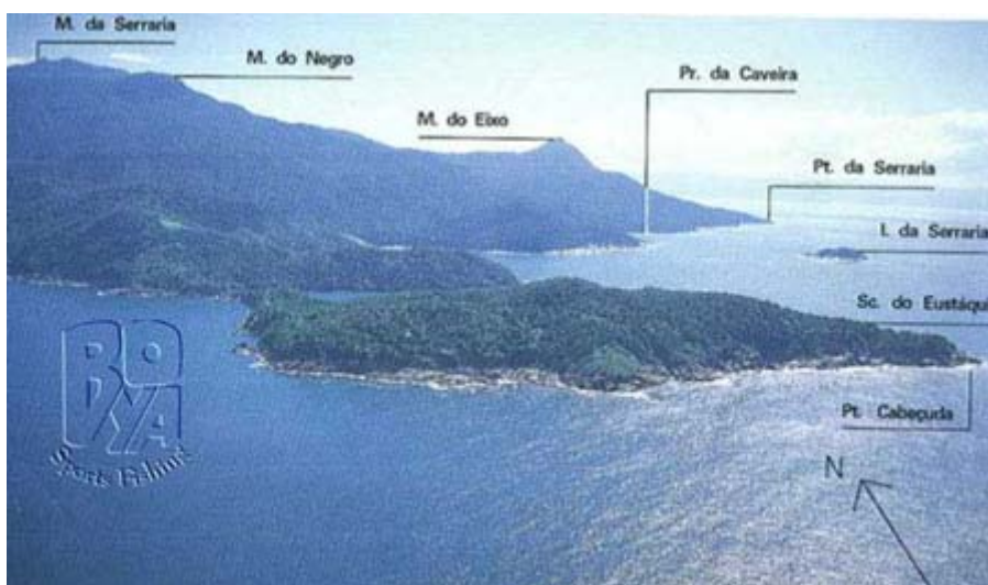
Figura II.5.2-4 - Ilha de São Sebastião - Área Centro-Leste ao sul da Ilha da Serraria (Saco do Eustáquio).