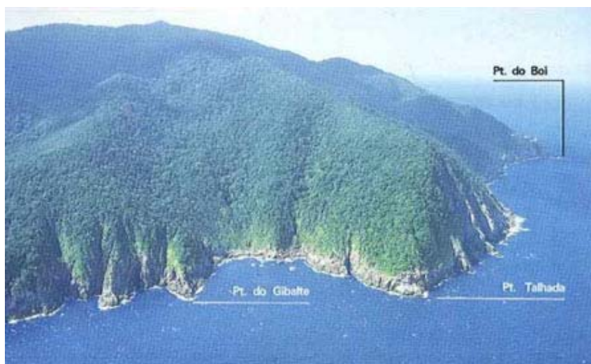
Figura II.5.2-2 - Ilha de São Sebastião - Área Sul, onde se localiza a Ponta do Boi.

Os 27 hectares do Parque Estadual de Ilhabela (PEIb) englobam 85% do município de Ilhabela, a Ilha de São Sebastião, sede do município, as ilhas dos Búzios e da Vitória, entre outras formações que compõem o arquipélago, como as Ilhas das Cabras, dos Pescadores, da Serraria e Ilhote Sumítica (SEMA-SP, 2005). A seguir são apresentadas fotografias aéreas de alguns pontos do Arquipélago de Ilhabela (Figuras II.5.2-2 a II.5.2-7).