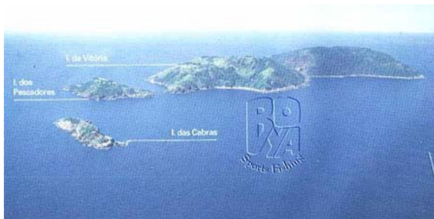
Figura II.5.2-7 - Ilhas da Vitória, dos Pescadores e das Cabras.