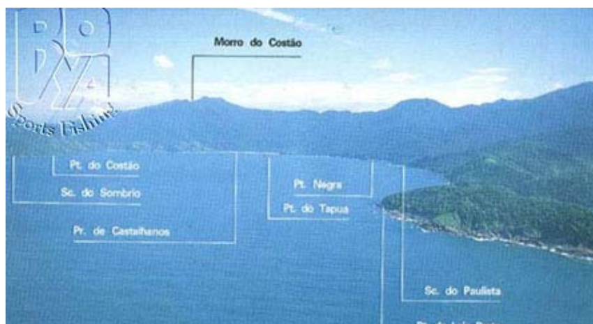
Figura II.5.2-3 - Ilha de São Sebastião - Área Centro-Leste (Baía dos Castelhanos).