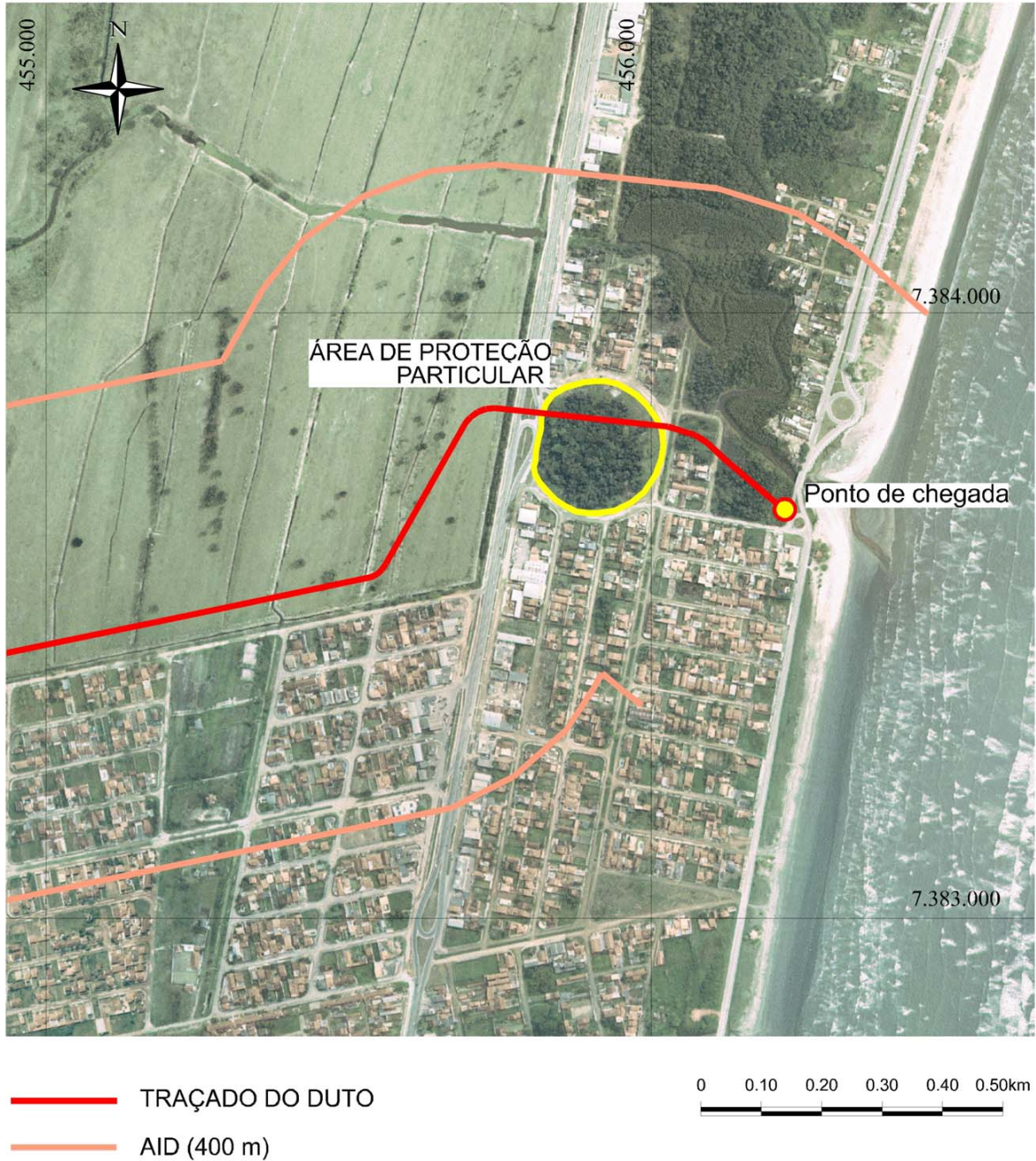
Figura II.5.2-8 - Área de proteção particular do Jardim Britânia.