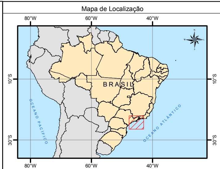
Mapa de Localização