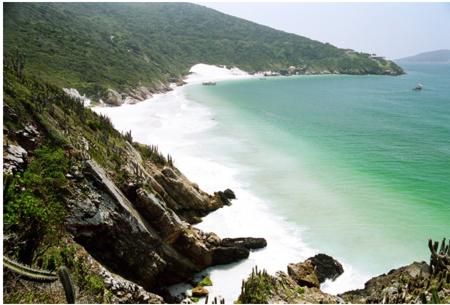
Figura 5.3.1-14. Praia do Pontal.

A Praia Brava tem ondas fortes e não é indicada para banhos. O acesso é feito a pé, pelo morro do Atalaia.