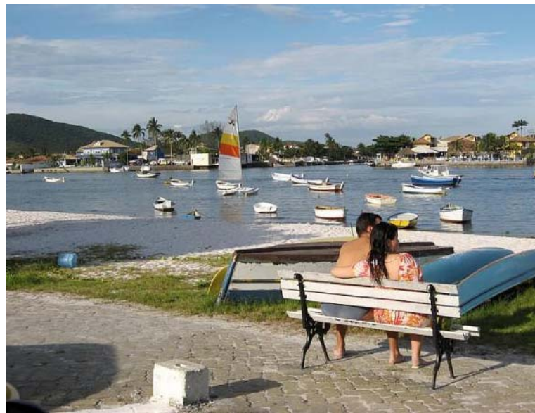
Figura 5.3.1-13. Vista da Praia e Canal Palmer em Cabo Frio.

Cabo Frio é um dos principais pólos turísticos do Brasil, suas belas praias de águas límpidas (Figura 5.3.1-13), areia branca fina, dunas, ilhas de rara beleza, salinas e enseadas atraem o turismo o ano todo.