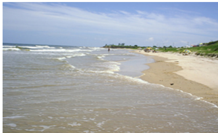
Figura 5.3.1-9. Vista do litoral do município de São Francisco de Itabapoana.

O município de São Francisco de Itabapoana nasceu do território desmembrado do município de São João da Barra entre a foz dos rios Paraíba do Sul e Itabapoana, na divisa com o estado do Espírito Santo. Possui um dos maiores perímetros de litoral do país com mais de 50 quilômetros de extensão, onde se destacam diversas paisagens por sua beleza e função socioambiental (Figura 5.3.1-9).