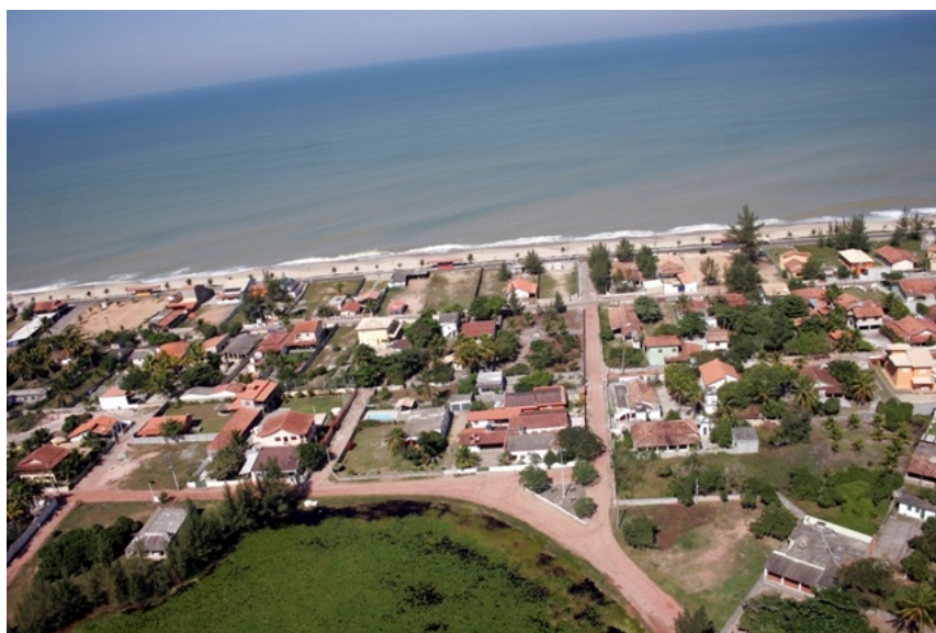
Figura 5.3.1-12. Lagoa Imboassica em Macaé.