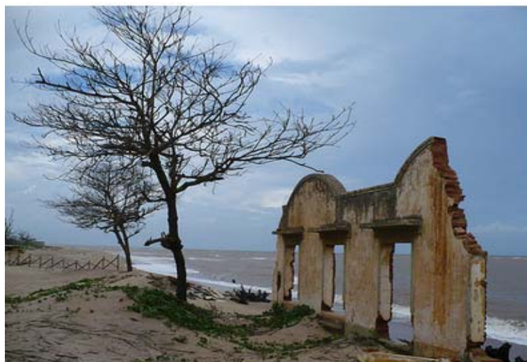
Figura 5.3.1-11. Pontal do Atafona em São João da Barra.

largura em torno de 25 m, possui águas com temperatura amena e coloração barrenta, atribuída ao vento sul que mistura as águas do rio Paraíba do Sul com as do Oceano Atlântico por um longo trecho da costa do Estado do Rio de Janeiro. A areia de granulação grossa e cor amarela apresenta inúmeras conchas e casca de mariscos.