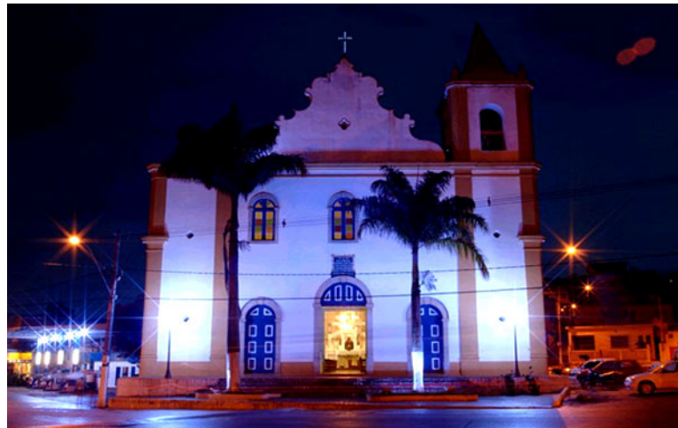
Figura 5.3.1-8. Igreja Matriz de Nossa Senhora do Amparo.