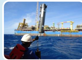
Projeto de Monitoramento Ambiental PMA