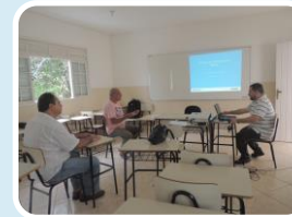
Projeto de Comunicação Social PCS