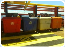
Projeto de Controle da Poluição PCP

A Chevron Brasil desenvolve cinco projetos ambientais para monitorar, controlar, reduzir e evitar que ocorram impactos ambientais e um Plano de Emergência Individual