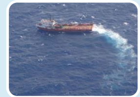
Plano de Emergência Individual PEI