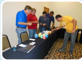
Projeto de Educação Ambiental dos Trabalhadores PEAT