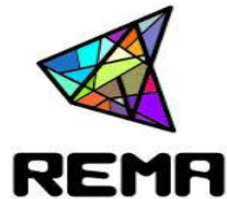
Projeto Educação Ambiental PEA