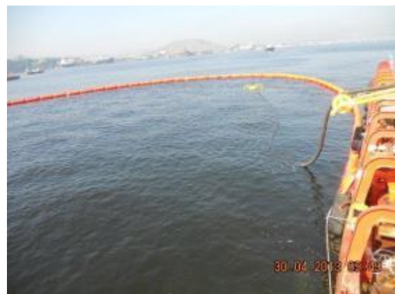
Formação em "J" e posicionamento do Skimmer