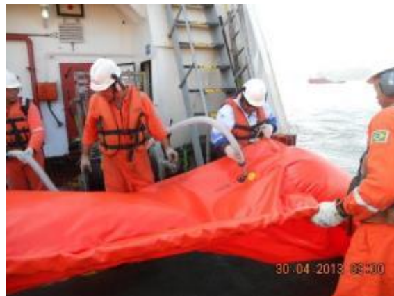
Lançamento Barreira de contenção