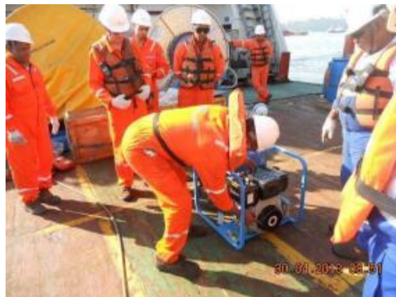
Briefing e teste dos equipamentos