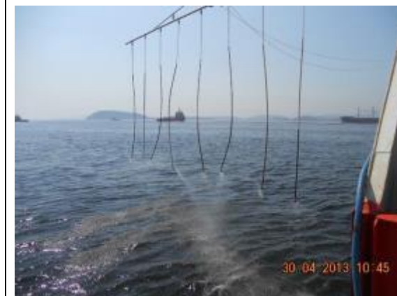
Acionamento do sistema de aplicação de dispersantes.