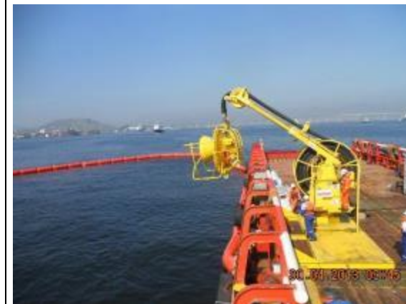
Formação em "U"