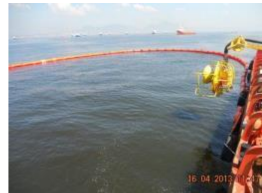
Formação em "U"