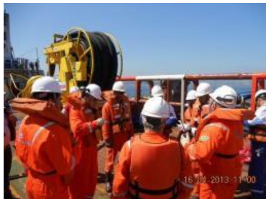
Briefing do Exercício