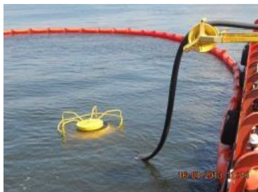
Formação em "J" e lançamento do Skimmer