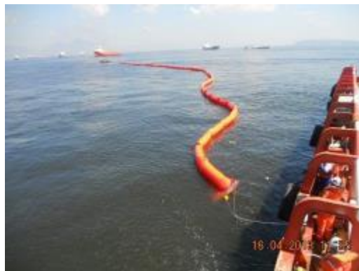
Lançamento Barreira de contenção