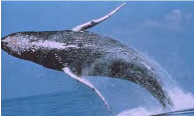
Figura II.5.2-27 - Baleia-jubarte ( Megaptera novaeangliae ).