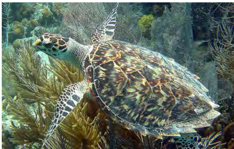
Figura II.5.2-26 - Tartaruga-de-Pente ( Eretmochelys imbricata ).

dos Recursos Naturais Renováveis (IBAMA, 2004), segundo a qual a tartaruga-cabeçuda ( Caretta. caretta ) e aruanã ( Chelonia. mydas ) são consideradas “vulneráveis”, a tartaruga-de-pente ( Eretmochelys. imbricata ) (Figura II.5.2-26) e a tartaruga-comum ( Lepidochelys olivacea ) são citadas como “em perigo” e tartaruga-de-couro ( Dermochelys. coriacea ) é considerada como “criticamente em perigo”. Segundo as classificações da IUCN Red List of Threatened Animals (2007), a Caretta caretta , a Chelonia mydas e a Lepidochelys olivacea são consideradas como "em perigo"; e a Dermochelys coriacea e a Eretmochelys imbricata como "criticamente em perigo".