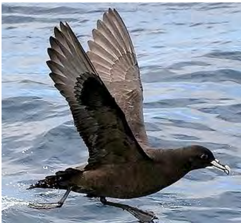
Figura II.5.2-25b - Pardela ( Procellaria aequinoctialis ).