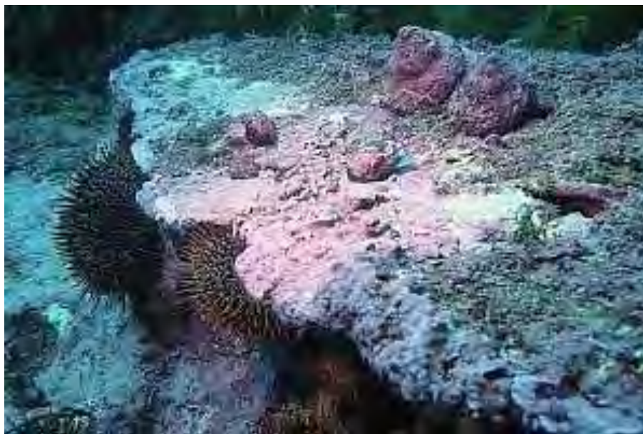
Figura II.5.2-24 - Presença de algas vermelhas coralináceas ( Lithothamnion sp.), com destaque para a coloração avermelhada característica.