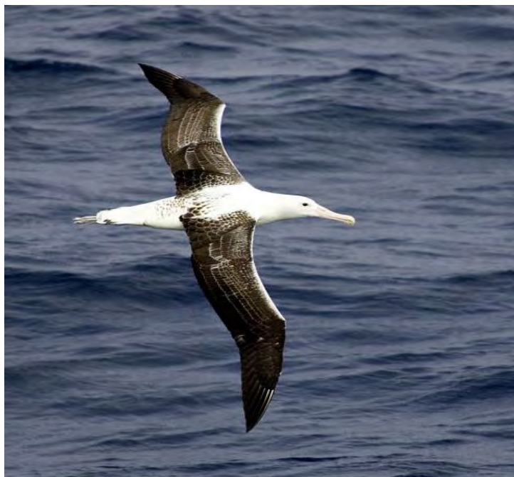
Figura II.5.2-25a - Albatroz-real ( Diomedea epomophora ).