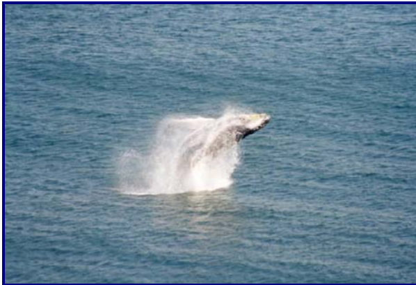
Foto 1: BALEIA-JUBARTE ( Megaptera novaeangliae )

A baleia franca-do-sul migra em período similar ao da baleia-jubarte. Pares de fêmeas com filhotes de baleia-franca apresentam um padrão migratório caracteristicamente costeiro, podendo chegar a poucos metros da praia. Esta espécie, atualmente, tem sua principal área de concentração para acasalamento e cria de filhotes na costa do Estado de Santa Catarina, ainda que existam registros regulares destas baleias até a região Nordeste do país.