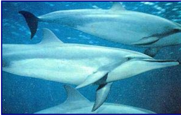
FOTO 2: GOLFINHO-ROTATOR ( Stenella longirostris )

rotator ( Stenella longirostris - Foto 2 ) são observados grupos de milhares de exemplares.