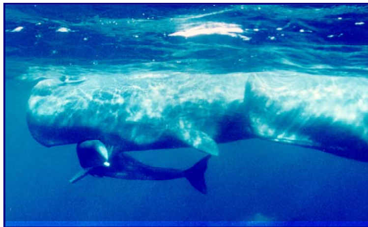
FOTO 3: CACHALOTE ( Physeter macrocephalus )

Já os cetáceos oceânicos de grande porte (comprimento médio acima de 8m) costumam ser solitários ou formar pequenos grupos e apresentam uma dieta especialista, como o cachalote ( Foto 3 ) e as baleias-bicudas (Família Ziphiidae) que se alimentam, basicamente, de lulas. Outras espécies, como o golfinho-de-risso ( Grampus griseus ), são encontradas em áreas que favoreçam a produtividade primária, como o talude e cânions submarinos.