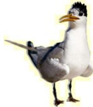
Trinta-réis-do-bico-amarelo ( Sterna eurygnatha )