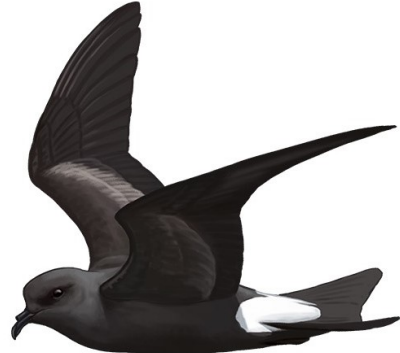
Painho-de-cauda-furcada ( Oceanodroma leucorhoa )