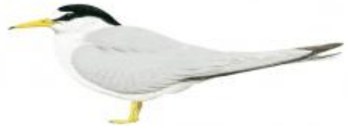
Trinta-réis-miúdo ( Sterna antillarum )