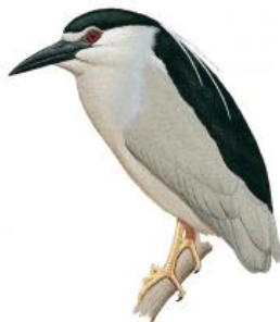
Savacu (Nycticorax nycticorax)