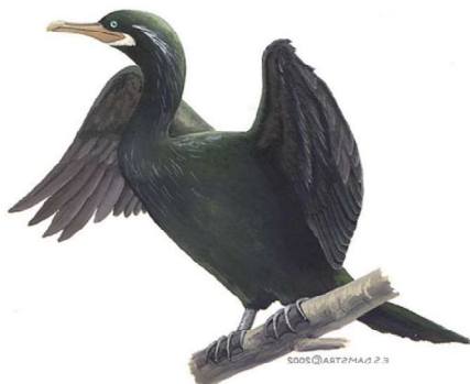
Biguá ( Phalacrocorax olivaceus )