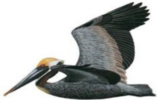
Pelicano-pardo ( Pelecanus occidentalis )