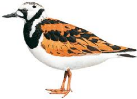
Vira-pedras (Arenaria interpres)