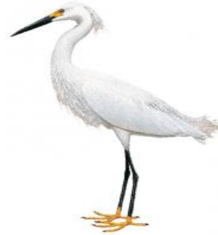
Garça-pequena-branca (Egretta thula)