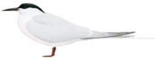
Trinta-réis-róseo (Sterna dougalli)