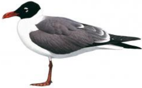
Gaivota alegre (Leucophaeus atricilla)