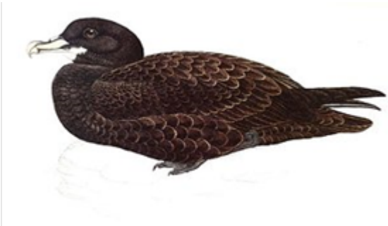
Pardela-preta ( Procellaria aequinoctialis )