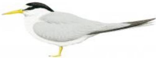
Trinta-réis-anão ( Sterna superciliaris )