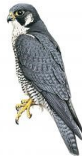
Falcão-peregrino (Falco peregrinus)