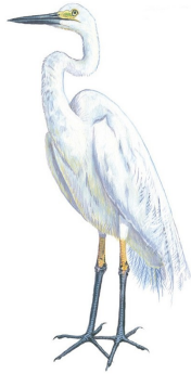
Garça-pequena-grande (Casmerodius albus)