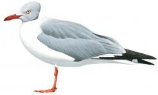
Gaivota-de-cabeça-cinza (Larus cirrocephalus)