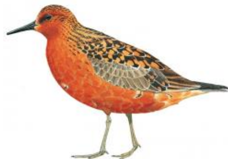
Maçarico-de-papo-vermelho (Calidris canutus)