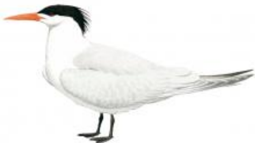
Trinta-réis-do-bico-preto ( Thalasseus maximus )