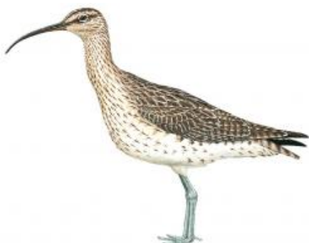
Maçaricão (Numenius phaeopus ssp.)