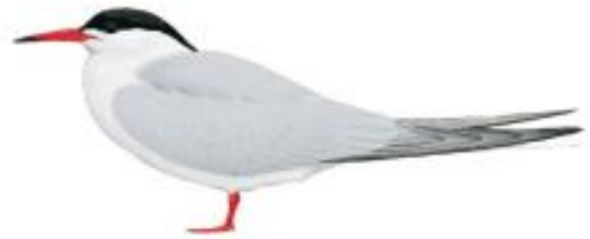
Trinta-réis-boreal (Sterna hirundo)