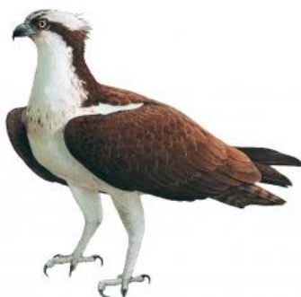
Águia-pescadora (Pandion haliaetus)