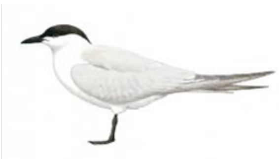
Trinta-réis-do-bico-preto (Gelochelidon nilotica)