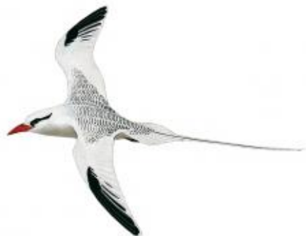
Rabo-de-palha-do-bico-vermelho ( Phaeton aethereus )