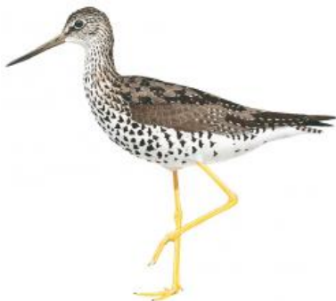
Maçarico-grande-da-perna-amarela (Tringa melanoleuca)