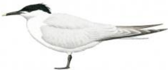
Trinta-réis-do-bando ( Thalasseus sandvicensis )