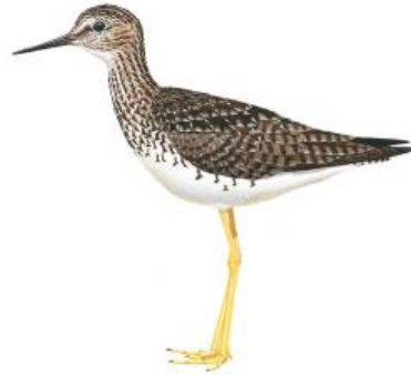
Maçarico-da-perna-amarela (Tringa flavipes)