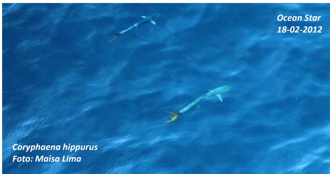
Foto: Sim ( x ) Não ( ) Fotos nº: 2012.02.18.BIOTA-255.F (7 e 9)